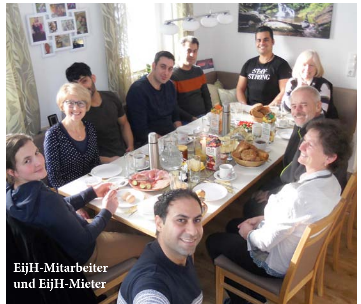
EijH-Mitarbeiter und EijH-Mieter