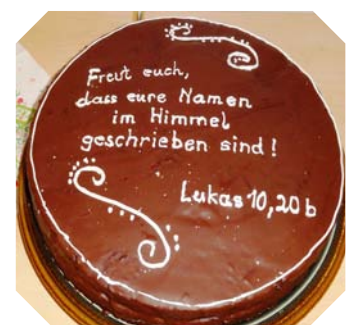
Freut euch, dass eure Namen im Himmel geschrieben sind! Lukas 10, 20 b