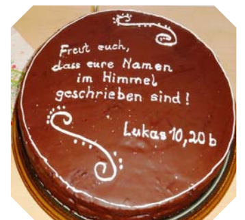
Freut euch, dass eure Namen im Himmel geschrieben sind! Lukas 10, 20 b